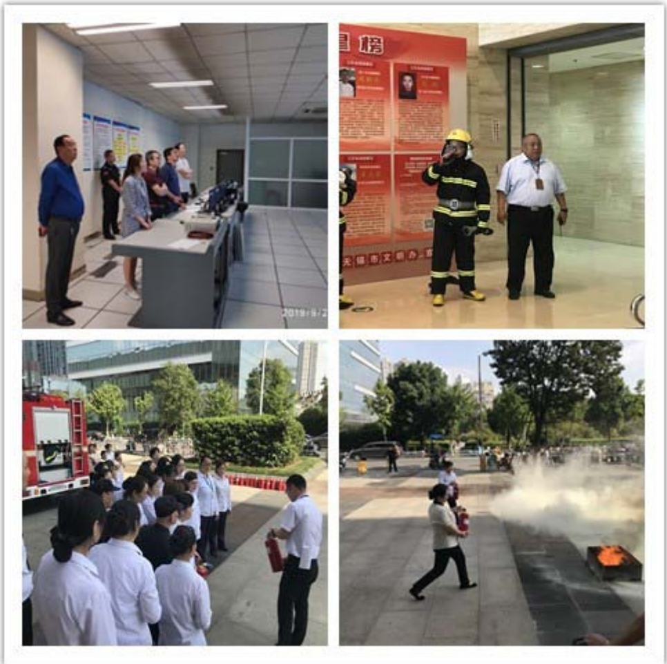
(撰稿：缪祺)

本次演练，大家热情高涨、积极参与、用心体会，通过亲身操作体验，增强了从业人员对消防安全知识的了解，熟悉了初期救火的各项应急操作，提高了消防安全防范意识和初期灭火能力，也提醒广大员工心系消防、警钟长鸣、共享平安。