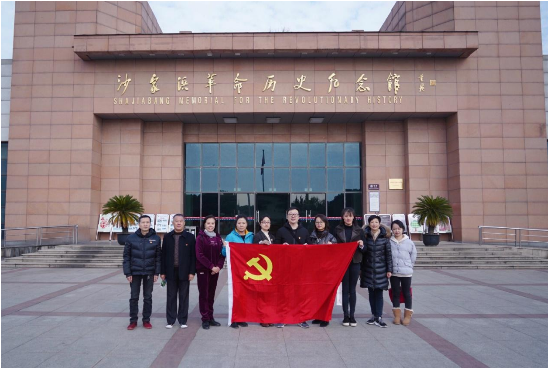
(撰稿：缪祺/摄影：李心然)

的年代、恶劣的环境中始终坚定信念、视死如归的高风亮节，从而进一步坚定了理想信念，增加了自身责任感和使命感，切实承担起各自的岗位职责，充分发挥先锋模范作用，为实现中华民族伟大复兴贡献自己的力量。